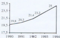
Graphique n° 2 : PIB par tête (en dollars)